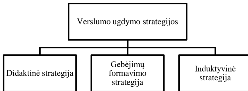
1 pav. Verslumo ugdymo strategijos