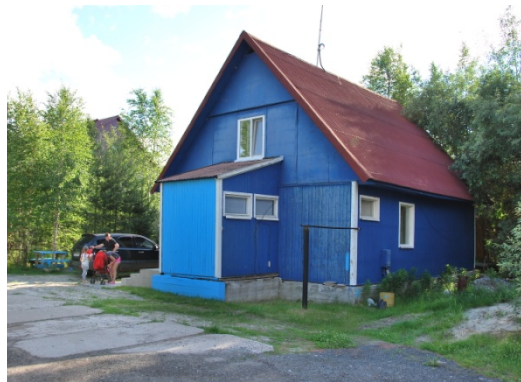
9 il. Vienas iš „alytukų“ 2018 m. vasarą

Alytaus skydiniai surenkamieji nameliai, taip pat vadinami alytnamiais , reprezentavo masinę kaimo architektūrą, kuri fenomenaliai išplito po visą Lietuvos Respublikos teritoriją sovietinio laikotarpio pabaigoje. Modernus individualus Alytaus namelis turėjo „priartinti kaimą prie miesto“, bet kartu nenukrypti nuo griežtų statybos industrializavimo reikalavi-