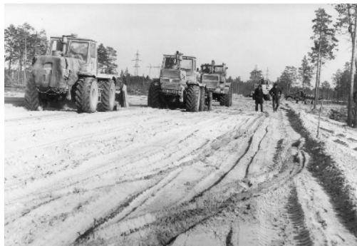
7 il. KSV-12 tiesia kelią Kogalymo apylinkėse