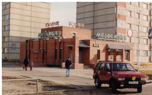
10 il. Dvikalbiai (lietuviški ir rusiški) užrašai (B. Galvelienės šeimos fotoarchyvas)

Baltijos statybininkų ir kelininkų pėdsakai Kogalymo mieste išlikę iki šiol. Juos pirmiausia mena vietovardžiai: Pabaltijo statytojų gyvenvietė ir gatvėvardžiai – Pabaltijo, Vilniaus, Rygos, Talino gatvės. Taip pat juos mena visuomeninių pastatų eksterjerai ir pavadinimai (kavinė „Meškiukas“ (žr. 10 il.), „Gintaro“ kino teatras (žr. 11 il.), Kaune, Rygoje, Taline projektuoti daugiabučiai namai ir „suomiški“ Pabaltijo statytojų gyvenvietės nameliai.