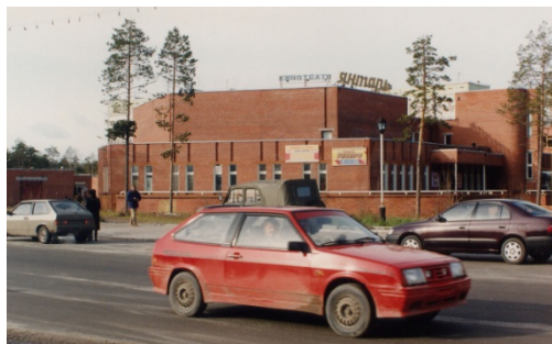
11 il. Kino teatras „Gintaras“ apie 1992 m. ant kavinės fasado Kogalyme apie 1992 m. (B. Galvelienės šeimos fotoarchyvas)