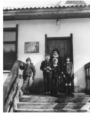
4 il. Lietuviška pradinė mokykla