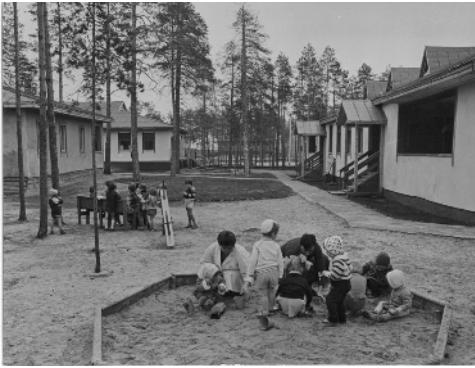
3 il. KSV-12 darbuotojų vaikų darželis

Žodis Sibiras baugino, bijojome šalčio, tačiau sunkiausia buvo pirmiesiems. Žiemą teko patirti 48 laipsnius šalčio ir tiek pat laipsnių karščio vasarą, „maškara“ 28 nelepino vasarą. Tačiau valdyboje gyvenimo sąlygos buvo puikios, buvo šilta butuose, laisvalaikiu galėjome eiti į kino salę žiūrėti filmų, buvo organizuojami įvairūs renginiai, konkursai, viktorinos, kuriuose visi noriai dalyvaudavome. Buvome jauni ir tikrai buvo įdomus ir geras laikas. Šeima buvo kartu – mes dirbome, sūnus galėjo lankyti mokyklą. (A. G., vyr., Kaunas, 2018)