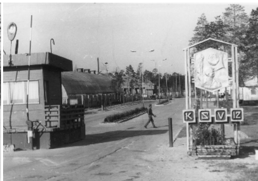
2 il. KSV-12 teritorija