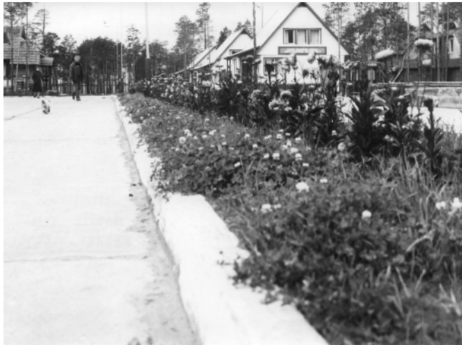
12 il. Gėlynai KSV-12 teritorijoje

Kogalymiečių pasakojimuose nuolat iškyla Baltijos kraštų kelininkų ir statytojų „kultūringas gyvenimo būdas“, pabrėžiamas jų „civilizuotumas“. „Tai kildavo iš jų bendrosios kultūros. Ir ten buvo švara ir tvarka, gazonai su žalia žole buvo laistomi vamzdeliais!.. Lietuvių kotedžai turėjo aukštus stogus. Ir nors stogai dengti ne čerpėmis, o šiferiu, bet buvo dažyti įvairiomis spalvomis! Uždavus klausimą „Kam to reikia?“ jie sutrikdavo, nežinodavo, ką atsakyti. Jiems atrodė, kad ir taip savaime suprantama, ką čia dar aiškinti. Po to, patraukę pečiais, atsakydavo: „Tam, kad gražu būtų!“ 40