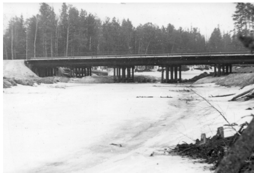
6 il. KSV-12 pastatytas tiltas per Ingujaguno upę

Iš viso per septynerius metus regione lietuviai pastatė daugiau kaip 30 tiltų, tarp jų ir tiltą per Ingujaguno upę (žr. 6 il.), sujungusį Pabaltijo statytojų gyvenvietę su Kogalymu. Nutiesė daugiau kaip 200 kilometrų kelių už daugiau kaip 100 milijonų rublių (žr. 7 il.). Buvo nutiesti keliai svarbiausioje – Kogalymo–Surguto – trasoje, į Sartymo Rušinskojė naftos verslovę, Cholmogorus, Urengojų ir kitomis kryptimis 32 . Vėliau, jau grįžus į Lietuvą, Vakarų Sibire įgyti specifiniai įgūdžiai pravertė tiesiant autostradą Kaunas–Klaipėda ties Rietavo apylinkių raistais 33 . Lietuvos kino studijoje apie išskirtinę savo pasiekimus KSV-12 net buvo sukurtas dokumentinis filmas „Kur tas kelelis pilkas“ (rež. P. Pukys, 1985 m.) 34 .