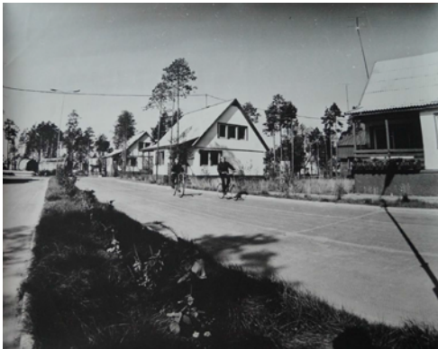
8 il. KSV-12 gyvenvietė 1987 m.

Regima „Mažųjų Vakarų“ ir savito baltų gyvenimo būdo iliustracija tapo jų pačių gyvenvietės vaizdas (žr. 8 il.). Remiantis G. Jankauskienės prisiminimais, Pabaltijo statytojų gyvenvietę, kurioje iš vienos kelio pusės įsikūrė Lietuvos kelininkai, o iš kitos – lietuvių, latvių ir estų statybininkai, vietiniai net juokais vadino atskira valstybe – „LiLaEst“, kuri esą užkariavo Sibirą 36 . Abiejų lietuviškų valdybų teritorijose, gyvenamajame kvartale, daugiausia buvo statyti skydiniai surenkamieji individualūs namai, skirti vienai šeimai, vadinamieji alytukai (žr. 9 il.).