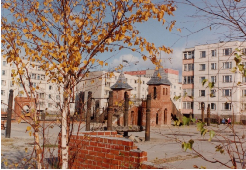
13 il. Lietuvoje esančių viduramžių Trakų pilį primenantį vaikų žaidimų aikštelė Kogalyms apie 1992 m.