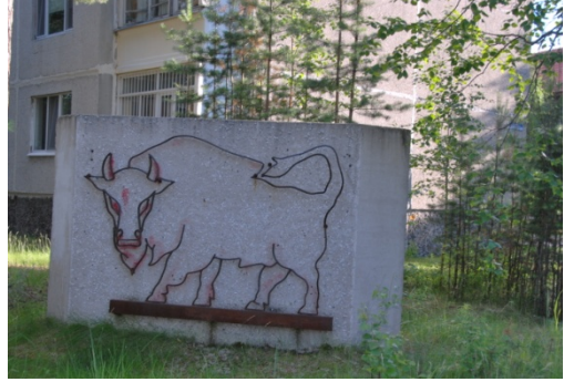
14 il. Kauno simbolis „Taurus“ Kogalyms 2018 m. vasarą