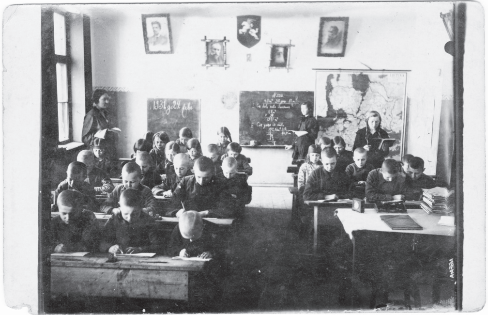
1 il. Daunoraičių II (latvių) pradžios mokyklos klasė bei mokiniai 1931 m. Ant sienų iš kairės į dešinę kabo Vinco Kudirkos, Prezidento Antano Smetonos, Lietuvos herbo – Vyčio, Krišjanio Valdemaro ir Jono Basanavičiaus portretai, žemėlapis su Lietuvos 1920 m. sienomis.

latvišką tapatybę. Kita vertus, dundurniekai nebuvo visiškai izoliuoti nuo juos supusios aplinkos – XX a. pirmojoje pusėje įsijungė į krašto ūkinį, visuomeninį gyvenimą, labai retais atvejais kūrė mišrias (konfesiniu ir tautiniu požiūriu) šeimas su buvusiais dvaro valdos ar gretimų kaimų lietuviais.