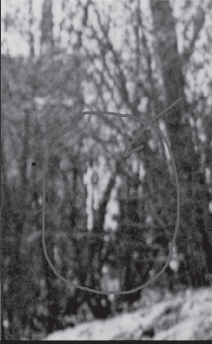
4 il. Išdidintas fragmentas (V. Banys). Mūrinis namas Gedimino g. (Kėdainių pieninės kiaušinių supirkimo punktas). 1938 m. Kėdainių šimtmetis fotografijose. 1918–2018, p. 49.