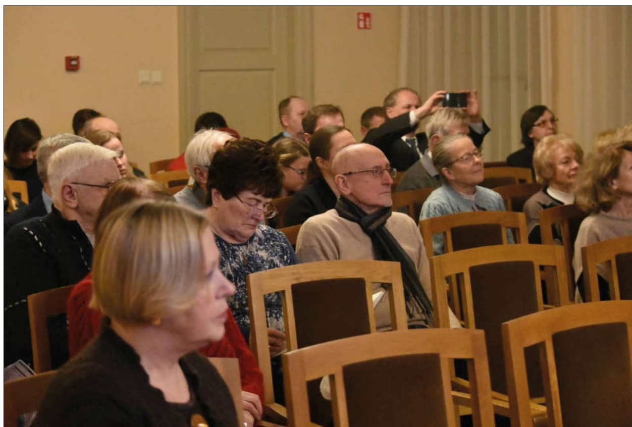
2 il. Leidinio pristatymo metu Signatarų namų salėje.