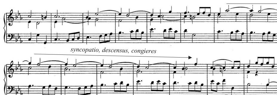
12 pav. Sonata „Jokūbo mirtis ir laidotuvės“, IV d. „Išlikusiųjų paguostos sielos“, 41–66 t.

Tiesa, pozityvią šios kompozicijos eigą kartkartėmis sudrumsčia besileidžiančios krypties ( descensus ) melodinės užtūros ( syncopatio ), suformuojančios besikeičiančias konsonansų (sektų) ir disonansų (septimų) sankaupas, taigi MRF congieres (12 pav.).