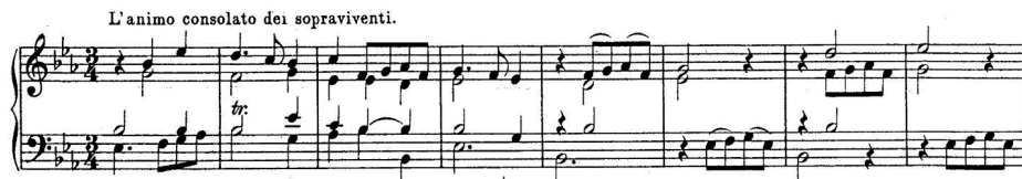
11 pav. Sonata „Jokūbo mirtis ir laidotuvės“, IV d. „Išlikusiųjų paguostos sielos“, 1–8 t.

Paskutinės dalies priedaše nurodytą paguodos afektą perteikia galjardos ritmas (11 pav.). Tridalis metras, pozityvaus afekto vienas komponentų, šokli ritmika, konsonansų harmonija čia pagaliau praskaidrina visą sonatą persmelkusią slogią atmosferą.