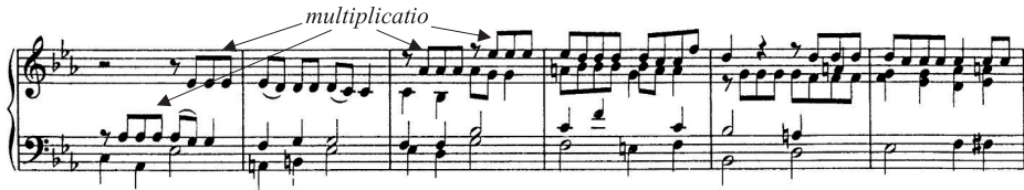
9 pav. Sonata „Jokūbo mirtis ir laidotuvės“, IV d. „Izraelio laidotuvės, palydimos karčia dalyvių rauda“, 13–18 t.

Visoje dalyje gausu chromatizmų, tačiau itin svarbia šios dalies dedamąja tampa MRF passus duriusculus (kvartos apimties chromatinė slinktis), kaip minėta, dažnai skausmingus afektus perteikianti figūra 26 . Rečitatyvo stiliaus ( stylus recitativus ) padalose ji skamba pusinių natų vertėmis bose (8 pav.), palydima padrikų, nutrūkstančių melodinių frazių viršutiniuose balsuose. Antroje, imitacinio pobūdžio padalose (13–47 t.) passus duriusculus net 4-is kartus girdima bose (23–24, 29–30, 32–34, 39–40 t.), o 5-ąją kartą (43–44 t.), tarsi skausminga raudos kulminacija, iškeliamą į viršutinį balsą (10 pav.).