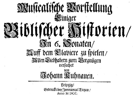
1 pav. J. Kuhnau. „Biblinės istorijos“, Leipcigas 1700, 1–2 tituliniai puslapiai.

Straipsnio tyrimo objektas – kompozitoriaus Johanno Kuhnau šeštoji sonata „Jokūbo mirtis ir laidotuvės“ ir į biblinės istorijos perteikimą orientuota muzikos kalba.