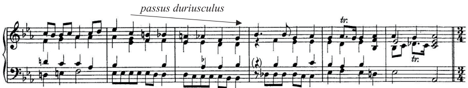
10 pav. Sonata „Jokūbo mirtis ir laidotuvės“, IV d. „Izraelio laidotuvės, palydimos karčia dalyvių rauda“, 42–47 t.

Visoje dalyje gausu chromatizmų, tačiau itin svarbia šios dalies dedamąja tampa MRF passus duriusculus (kvartos apimties chromatinė slinktis), kaip minėta, dažnai skausmingus afektus perteikianti figūra 26 . Rečitatyvo stiliaus ( stylus recitativus ) padalose ji skamba pusinių natų vertėmis bose (8 pav.), palydima padrikų, nutrūkstančių melodinių frazių viršutiniuose balsuose. Antroje, imitacinio pobūdžio padalose (13–47 t.) passus duriusculus net 4-is kartus girdima bose (23–24, 29–30, 32–34, 39–40 t.), o 5-ąją kartą (43–44 t.), tarsi skausminga raudos kulminacija, iškeliamą į viršutinį balsą (10 pav.).