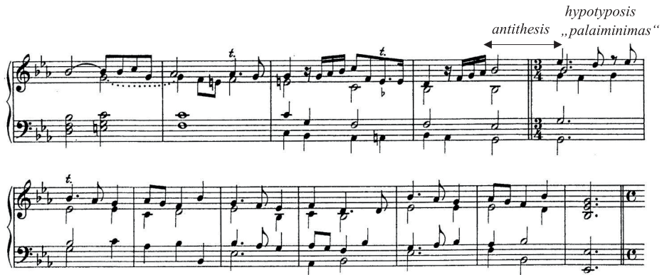
4 pav. Sonata „Jokūbo mirtis ir laidotuvės“, I d. „Jokūbo vaikų skausmas prie mylimo tėvo mirties patalo, nuramintos tėvo palaiminimo“, 71–78 t.

Kompozitorius pasitelkė tokią muzikos faktūrą, kurią kitose sonatose vartojo padrašiniui, atgaivai, nuraminimui perteikti 19 . Tai trys konsonansiški epizodai 23–36, 41–48, 71–78 taktuose, išsiskiriantys iš muzikos konteksto: čia keičiasi faktūra, harmonija bei metras – iš keturdalio (C) į tridalį (3/4) 20 . Tokie muzikos išraiškos priemonių pokyčiai muzikos retorikos terminais vadinti antithesis . Šiuo konkrečiu atveju muzikinis kontrastas sietinas su afektų pokyčiu iš neigiamo (nerimo) į teigiamą (nuraminimą / palaiminimą). Be to, pirmoji padala atspindi tai, kaip besiertinančią tėvo mirtį priima vaikai, o tridalė – paties Jokūbo ramumą (4 pav.).