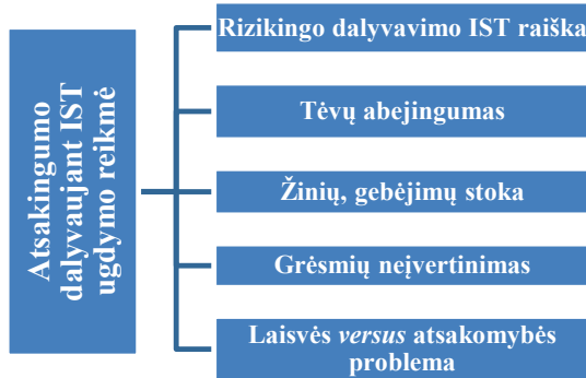
1 pav. Mergaičių atsakingumo dalyvaujant interneto socialiniuose tinkluose ugdymo reikmė

dalyvaujant IST ugdymas yra būtinas dėl šių priežasčių: rizikingo dalyvavimo IST raiškos, tėvų abejingumo, žinių ir gebėjimų stokos, grėsmių neįvertinimo, laisvės versus atsakomybės problemos (1 pav.).